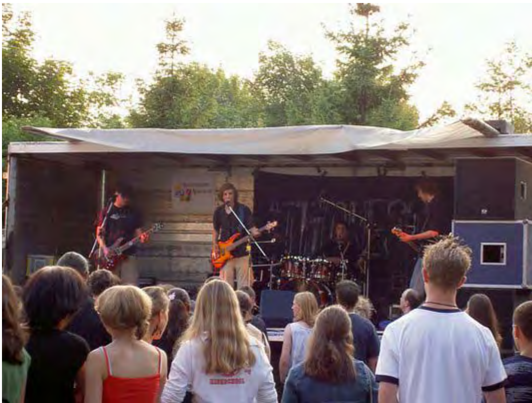
Die Band thinkless bei ihrem Auftritt bei Rock im Schulhof in Aulendorf