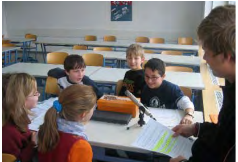
Groß hilft klein: Hörspielprojekt Klasse 5

„Berufe“, „Weihnachtsspecial“, „Hexenjagd“, „Spanien“, „Zukunft“, „Beste Freunde“ – so hießen die Themen der Sendungen des vergangenen Schuljahres, doch der Höhepunkt stand noch aus. So gab es am 29.6.2006 passend zum Thema eine 90minütige Sendung live vom Fancamp in Stuttgart, natürlich zum Thema Fußball!