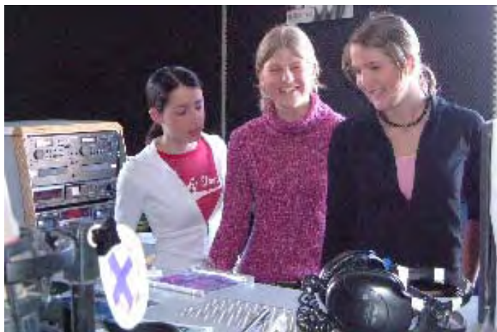
Bei Radio FreeFM

„DiLämma“ – nur eine kurze medienpädagogische Blüte?