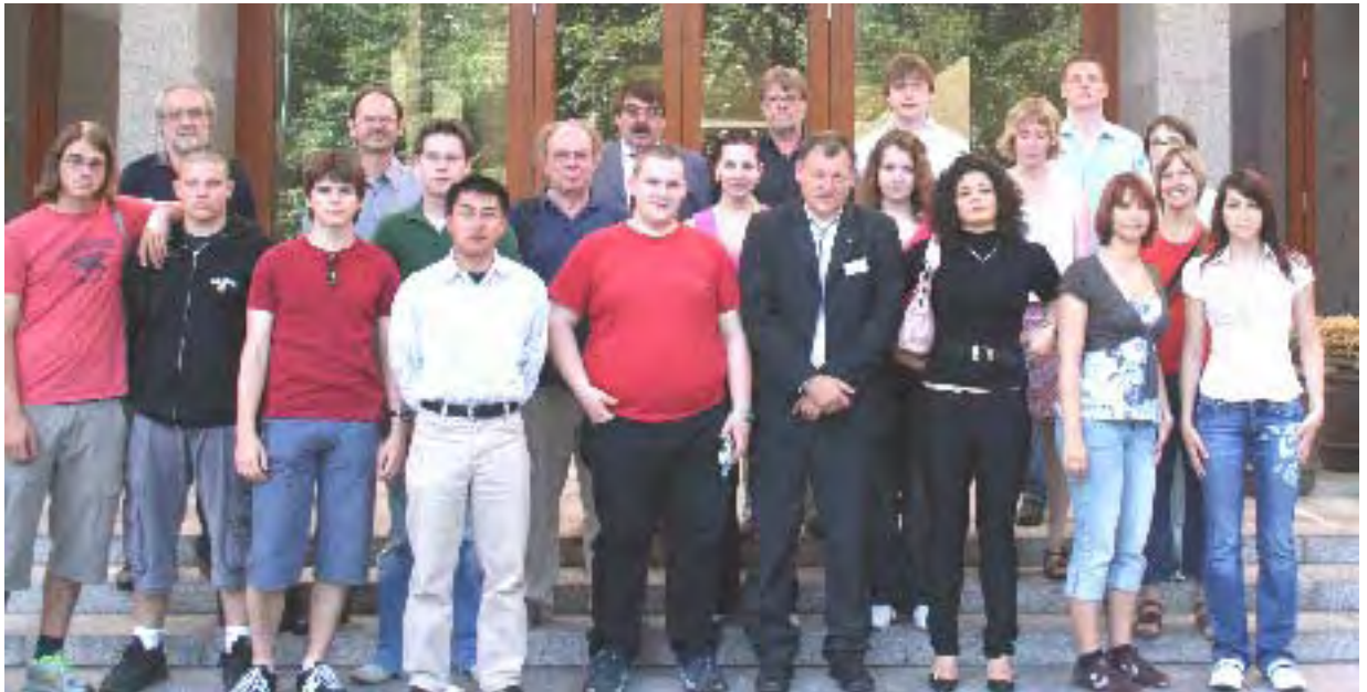
Baden-Württ. Preisträger mit ihren betreuenden Lehrern vor der Landesvertretung

Am 13. Juni 2006 waren die baden-württembergischen Preisträger in die Landesvertretung eingeladen und wurden dort darüber hinaus geehrt.