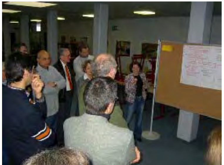
Kollegium in Aulendorf am pädagogischen Tag

Zu diesem Zeitpunkt wurden uns vom RP Tübingen zwei erfahrene Prozessbegleiter zur Seite gestellt, die uns in der Schule bei der Auswertung und den folgenden Schritten unterstützen. Es folgten Konferenzen der Lehrer, die drei wesentliche Punkte festgestellt haben, an denen vordringlich gearbeitet werden sollte. Unter anderem waren dies der fächerverbindende Unterricht und der Einsatz neuer Medien im Unterricht. Da hatten die Schüler in ihren Fragebögen deutlich gemacht, dass dies doch verstärkt werden könnte.