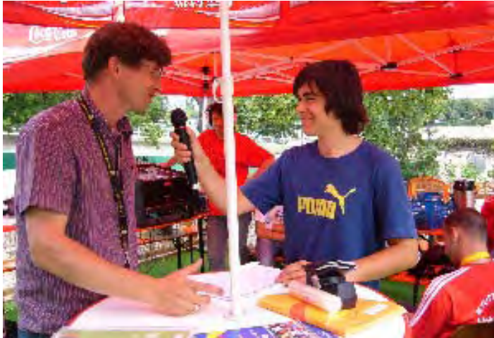
Live Sendung bei der Fußball-WM

Umrahmt von der Teststrecke der Firma Daimler-Chrysler fanden sich im alten Reitstadion Interviewgäste ein, um von ihren Erfahrungen mit der WM 2006 zu berichten: Volunteers, der