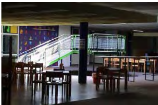
Foyer der Geschwister-Scholl-Schule

Eine Idee ist schnell im Kopf – schwieriger wird es da meist bei der Umsetzung der Ideen. In diesem Fall hatten wir wohl einfach sehr viel Glück. Die wichtigste Frage für uns war natürlich erst einmal WO das Ganze und WOHER kommt all das technische Equipment?