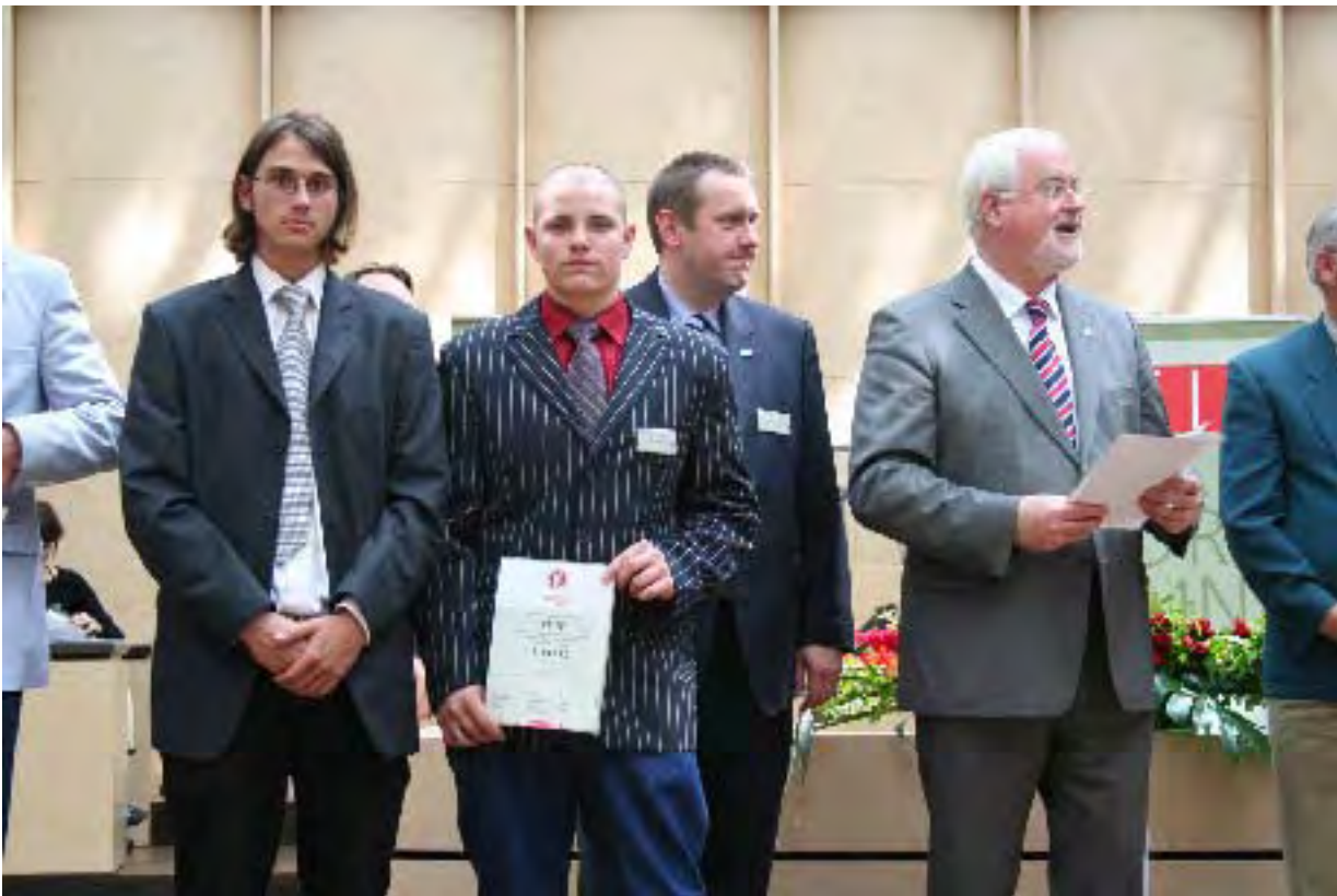
Redaktion Pfiff mit Bundesratspräsident Carstensen (rechts)

Aus dem Bereich des Regierungspräsidiums Tübingen hat die Schülerzeitung „Pfiff“ der Sommertalschule (GHS) Meersburg für die Schulart Hauptschule den 2. Preis erreicht.