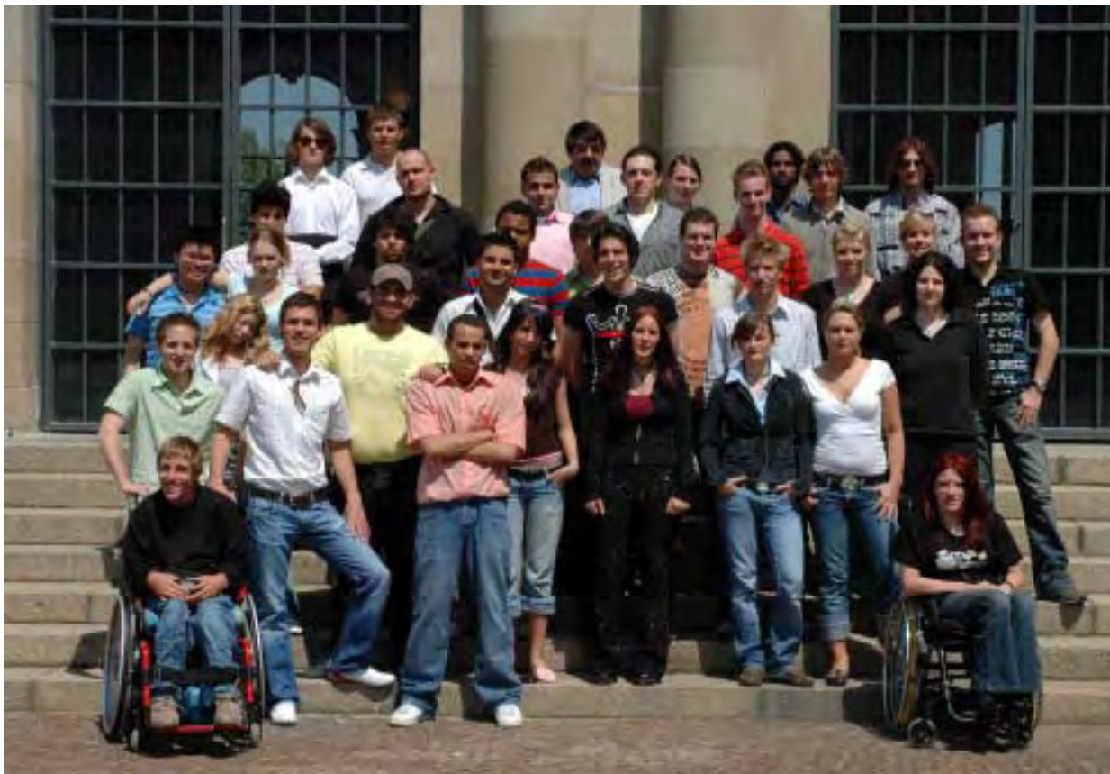
Der 7. LSBR auf einen Blick