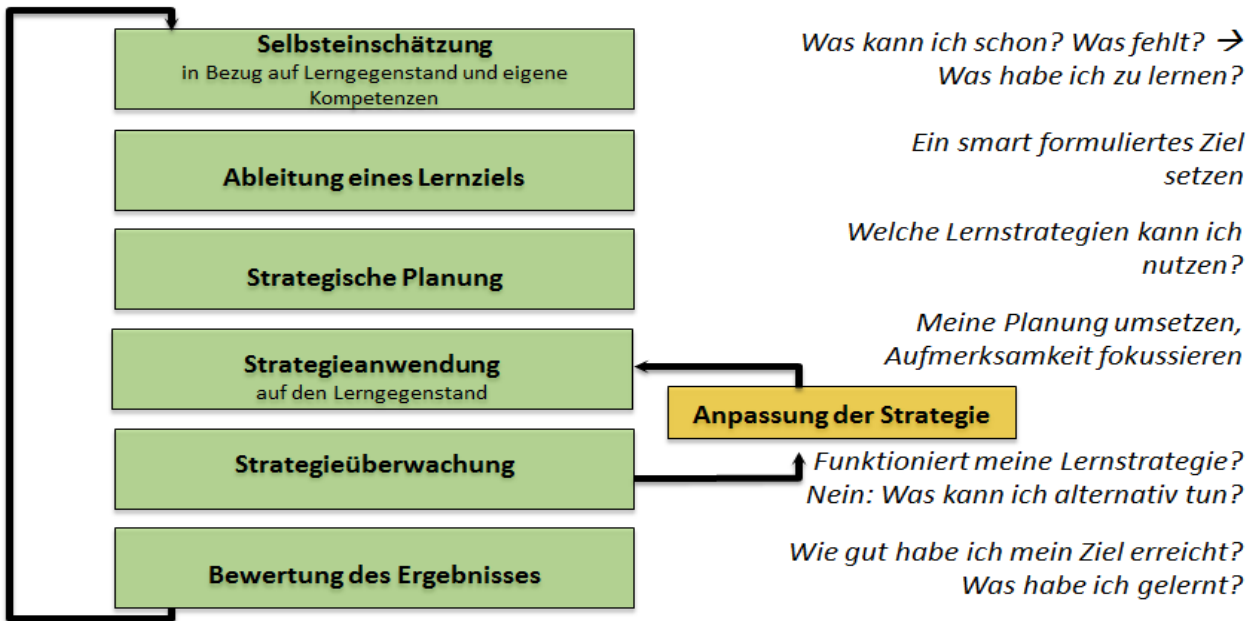
Abb. 1: Der siebenstufige Zyklus selbstregulierten Lernens (u. a. Ziegler & Stöger, 2005)

Aspekte der zentralen Lern- und Handlungsfelder, der Grund- und Primärprävention finden sich in jeder Unterrichtsstunde wieder und sind nicht losgelöst voneinander wirksam. Prävention und Gesundheitsförderung braucht die Auseinandersetzung mit folgenden Fragen: